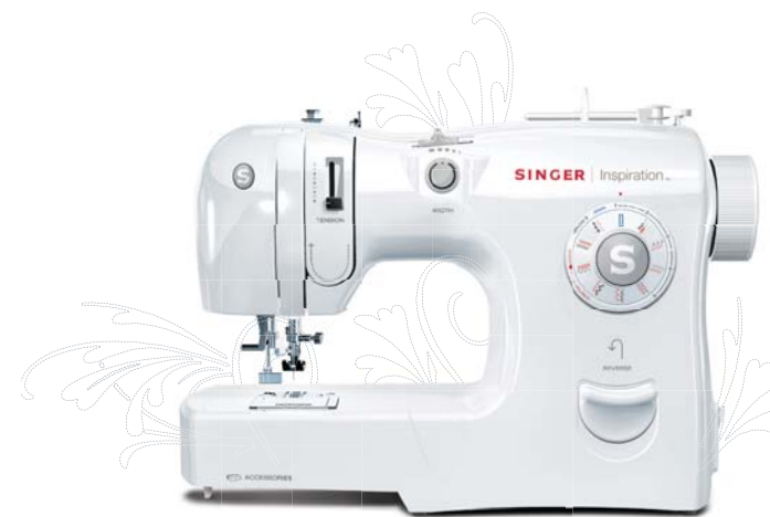
MODEL 4220 MODELO 4220